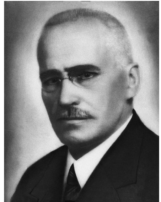
fol. Muzeum AGH