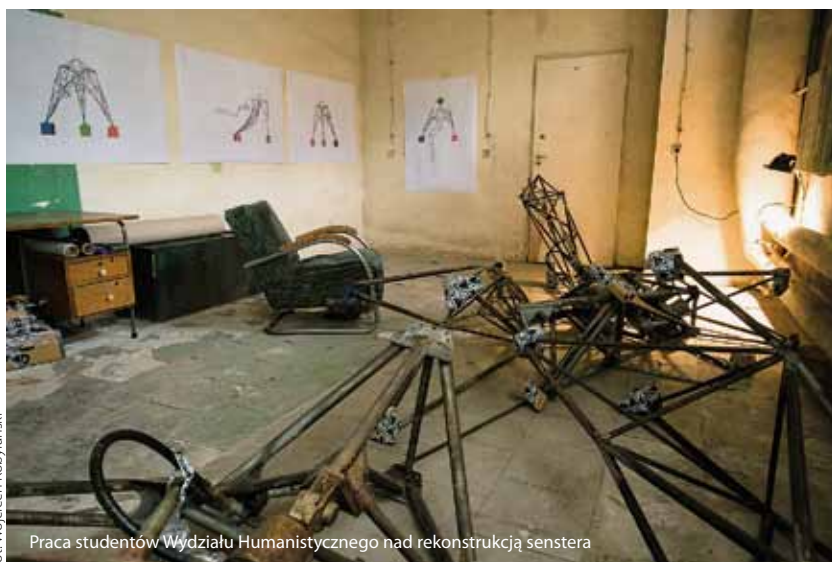
Praca studentów Wydziału Humanistycznego nad rekonstrukcją sensera