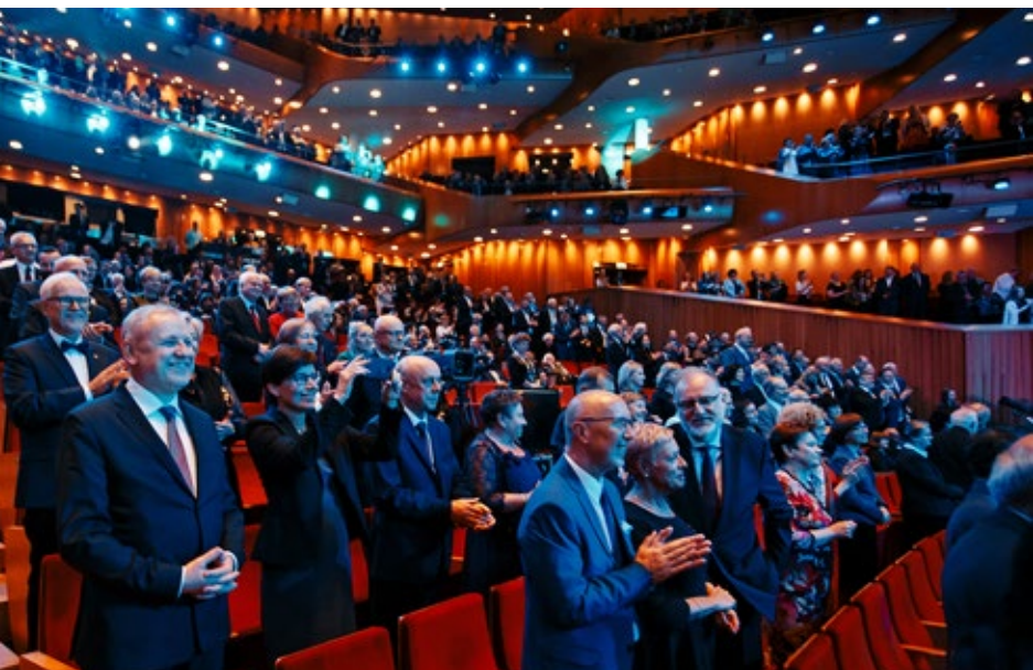
Nasi goście w Centrum Konferencyjnym

małymi i średnimi przedsiębiorstwami. Ciągłe jest problemem, jak uchwycić w ramy prawne coś, co rozwija się tak szybko jak technologie. Dlatego warto wrócić do początków tej uczelni i do jej dwóch pierwszych doktorów honorowych. Stanisław Wojciechowski – Prezydent Rzeczypospolitej Polskiej, który nosił w sobie ducha wartości też Rzeczypospolitej, której nie było na mapie. Z wykształcenia technik, został pierwszym doktorem honoris causa. Drugim był Wojciech Korfanty. Mówię o tym ze szczególnym wzruszeniem, bo też jestem Ślązakiem z dziada pradziada. To było podkreśleniem nadzwyczajnym, szczególnej wartości, jaką przywiązuje ta wszechnica do tak bliskiego pobratymczego Śląska. To są już odległe dzieje, ale bez tej uczelni i bez wsparcia intelektualnego odzyskanego właśnie przez Polskę śląskiego i zagłębiowskiego przemysłu, nie moglibyśmy zbudować przed wojną Gdyni, ani Centralnego Okręgu Przemysłowego, ani doskonałej sieci dro-