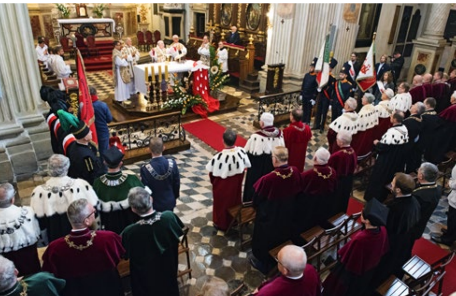
Uroczysta jubileuszowa msza święta w Kolegiacie św. Anny w Krakowie