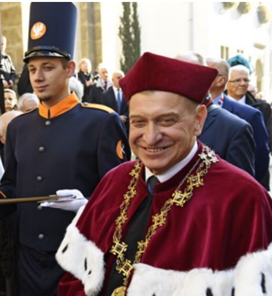
Początek uroczystego przemarszu Społeczności Akademickiej AGH spod Kolegiaty św. Anny do Collegium Novum UJ