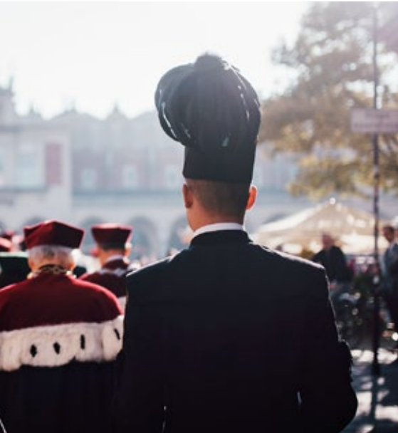
Przejście pochodu jubileuszowego ulicami Krakowa