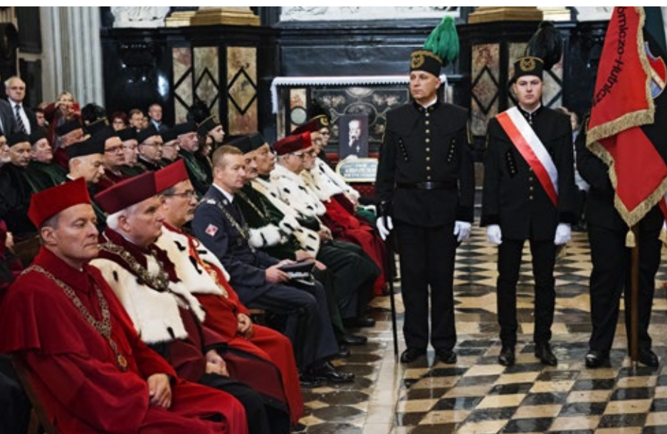
Uroczysta jubileuszowa msza święta w Kolegiacie św. Anny w Krakowie