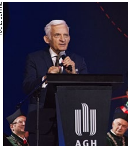
Prof. Jerzy Buzek - doktor honoris causa AGH