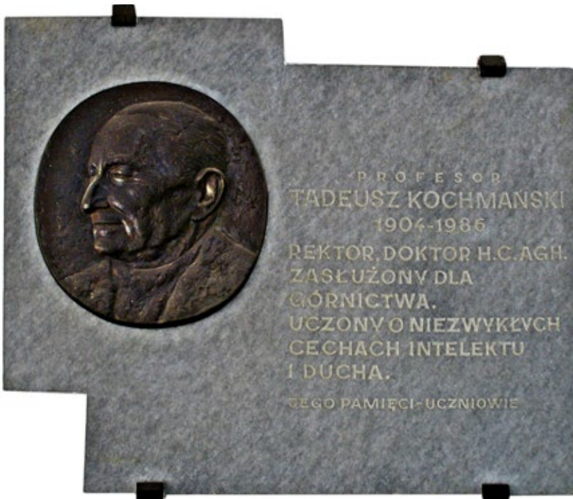
Tablica pamiątkowa na pierwszym piętrze w pawilonie C-4

Jego praca doktorska polegała na wprowadzaniu metody najmniejszych kwadratów do rozwiązywania i wyrównywania kopalnianych sieci wentylacyjnych. Z kolei w swej rozprawie habilitacyjnej przedstawił niektóre zastosowania krakowianów do geodezji, górnictwa i matematyki stosowanej. W pierwszych latach profesor zajął się głównie twórczym przystosowaniem krakowianów do potrzeb geodezji i innych dyscyplin. Efektem były metody krakowianowe rozwiązywania podstawowych zadań geodezyjnych, przynoszące efekty techniczne i ekonomiczne. Metody ekonomicznego obliczania niwelacji, opracowane przez niego i zastosowane w Okręgowym Przedsiębiorstwie Mierniczym w Krakowie, zostały objęte w 1952 roku ochroną prawną. Następnie profesor