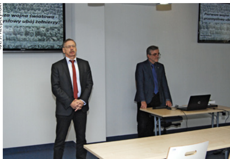
fot. J. Rzepczyński