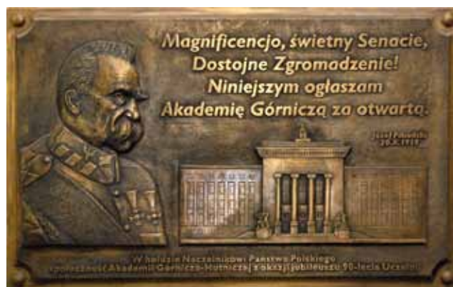
fort. Z. Sulima

Mamy nadzieję, że zaproponowany cykl zostanie życzliwie przyjęty przez społeczność akademii.