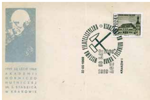
Rys. 2. Dwie koperty okolicznościowe przygotowane przez organizatorów obchodów 50-lecia AGH z datownikami Wystawy Filatelistycznej stosowanymi w UPT Kraków 1 (22.05.1969 i 24.05.1969).