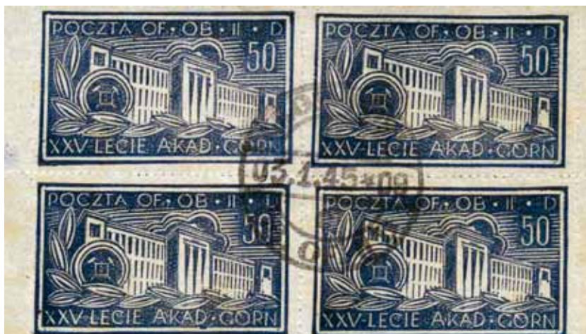
Rys. 1. Czworobok znaczków pocztowych

wydanych przez pocztę obozu jenieckiego GROSS-BORN (Obóz II D) z okazji 25-lecia AG.