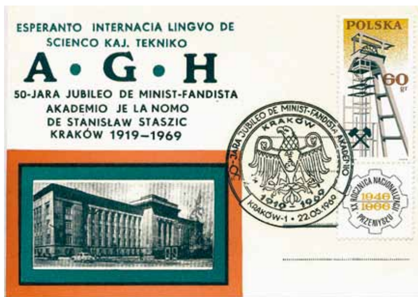
Rys. 3. 50-lat AGH – kartka okolicznościowa i datownik w języku esperanto.

wydanych przez pocztę obozu jenieckiego GROSS-BORN (Obóz II D) z okazji 25-lecia AG.