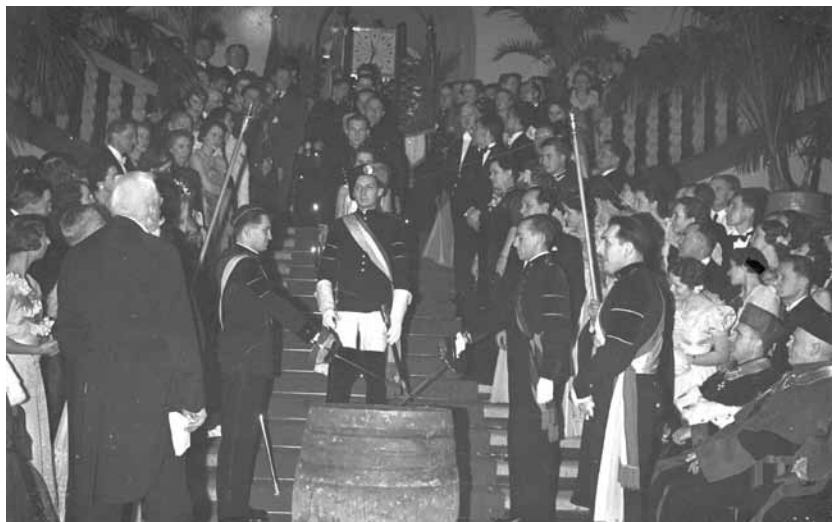
Fragment uroczystości barbórkowych z udziałem studentów – data: 1938/12

Tak spodziewamy się wizyty pana prezydenta. Należy dodać, że najważniejsze daty jubileuszowe to 18 i 19 października 2019. W 2019 roku nie będzie inauguracji roku akademickiego 4 października, tak jak to mamy w zwyczaju od wielu, wielu lat. Uroczysty Senat inauguracyjny odbędzie 19 października 2019 roku i wtedy właśnie liczymy się z wizytą pana prezydenta i zapewne innych osób z rządu i parlamentu. Mamy nadzieję na wizytę bardzo wielu zna-