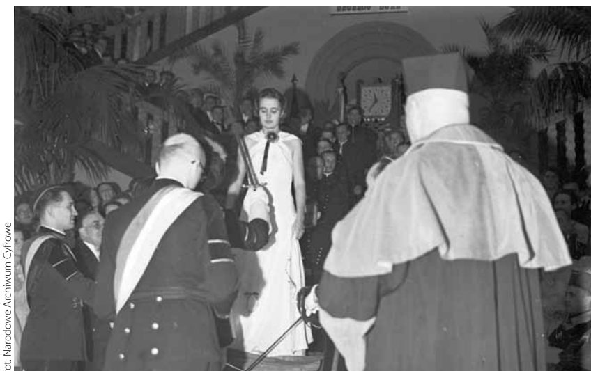
Fragment uroczystości barbórkowych z udziałem studentów – data: 1938/12