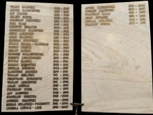
Tablica poświęcona Członkom Honorowym Stowarzyszenia Wychowanków AGH w budynku głównym AGH