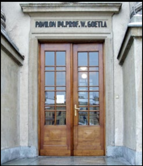
Wejście do budynku głównego AGH noszącego imię prof. Walerego Goetla