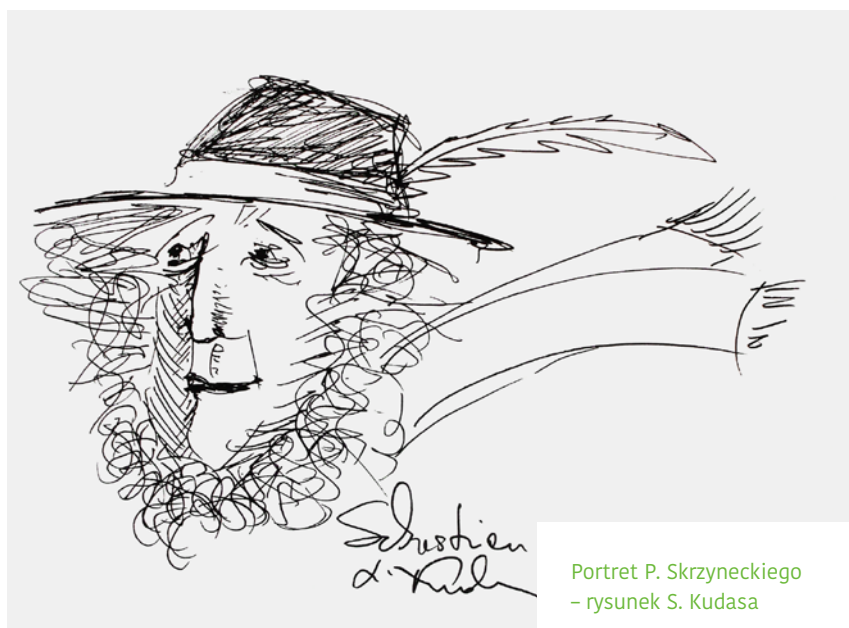
Portret P. Skrzyneckiego – rysunek S. Kudasa

W zaproszeniu na wernisaż i plakacie wykorzystano rysunek S. Kudasa