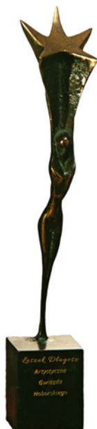
Artystyczna Gwiazda Hoborskiego